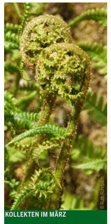
KOLLEKTEN IM MÄRZ