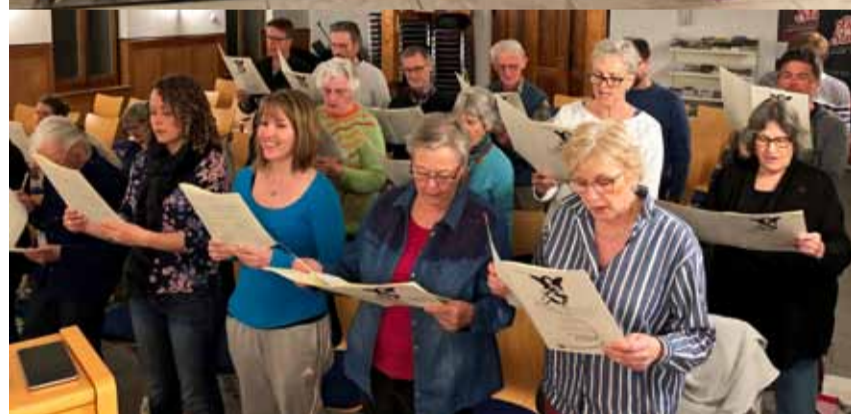
Oben: Kirchenchöre der KG Oberbalm und der EMK Schlatt bei der Probe.