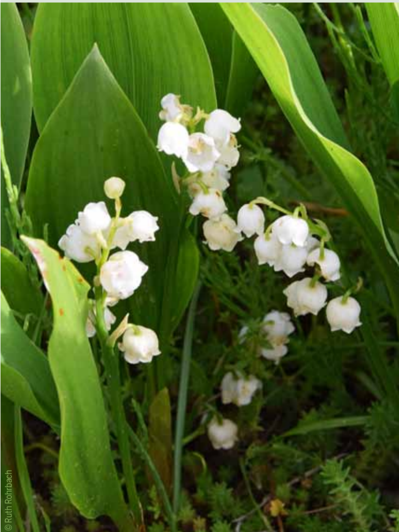
GOTTESDIENSTE IM MAI